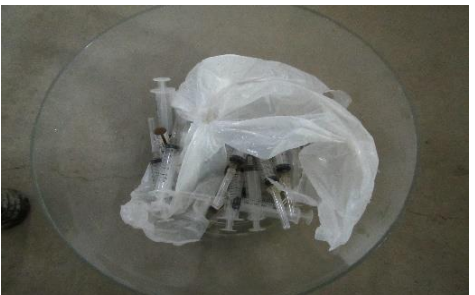
三芳町 注射針 3月6日