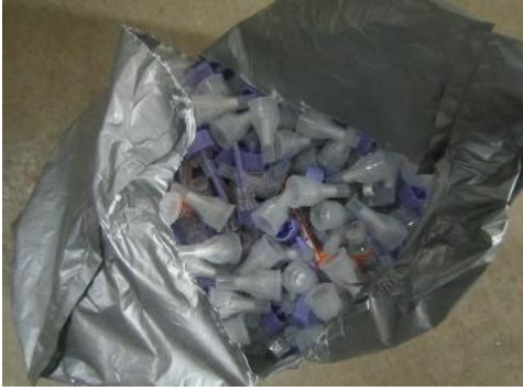
ふじみ野市 注射針 6月29日