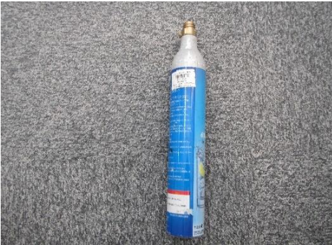
ふじみ野市 炭酸ガスボンベ 2月9日