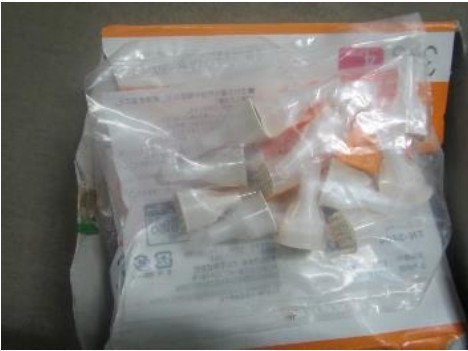
三芳町 注射針 7月5日