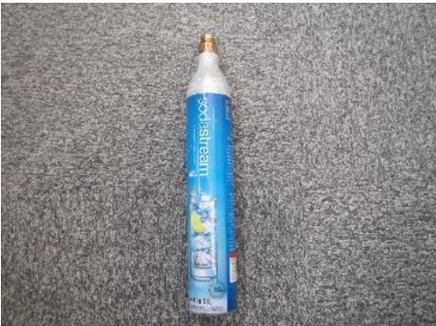
ふじみ野市 炭酸ガスボンベ 10月6日