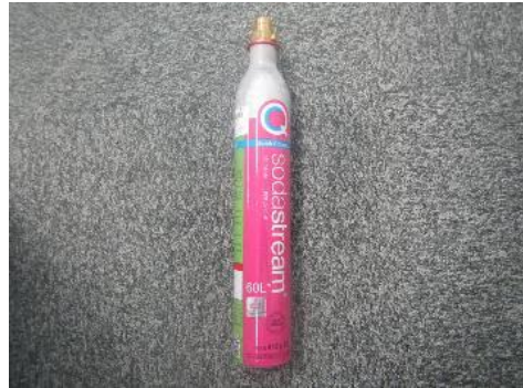
三芳町 炭酸ガスボンベ 7月10日