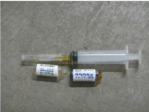
ふじみ野市 注射針 12月15日