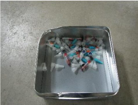
ふじみ野市 注射針 11月13日