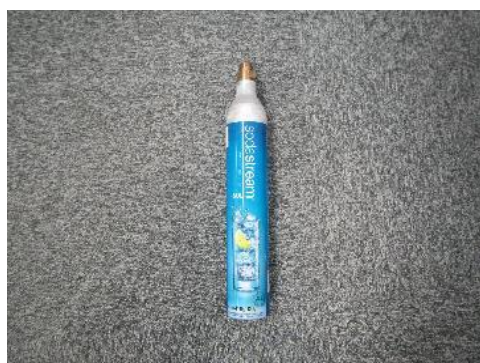
ふじみ野市 炭酸ガスボンベ 9月29日