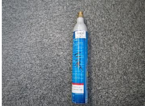
三芳町 炭酸ガスボンベ 7月24日