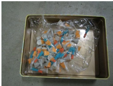
三芳町 注射針 3月5日