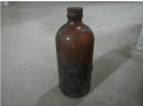
ふじみ野市 薬品? 7月11日