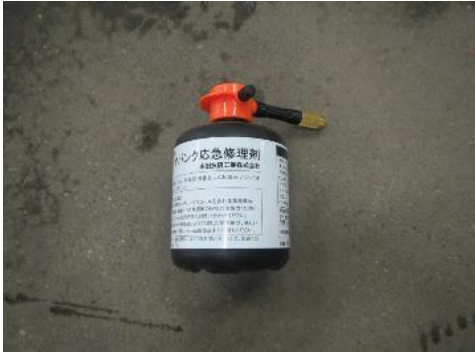
三芳町 パンク修理剤 7月21日