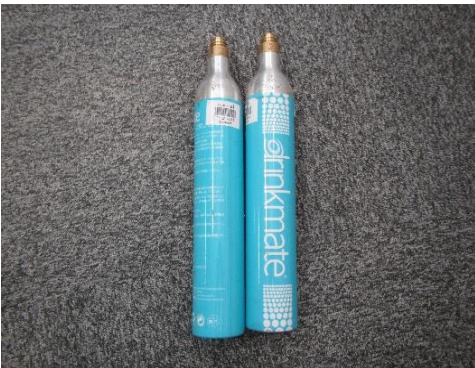
ふじみ野市 炭酸ガスボンベ 12月7日