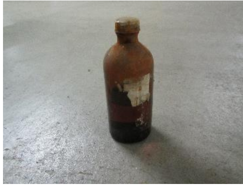
三芳町 薬品 11月13日