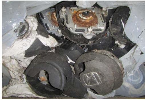
多数のエアバッグ 2月26日