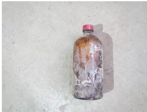
ふじみ野市 薬品? 12月8日