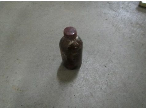
三芳町 薬品 3月5日