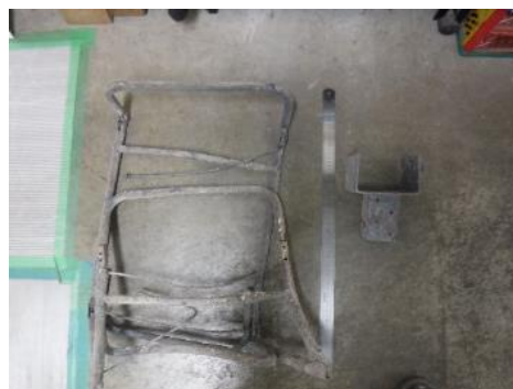
熱回収施設 パイプ椅子 5月10日