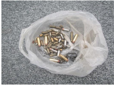
ふじみ野市 銃弾? 11月14日