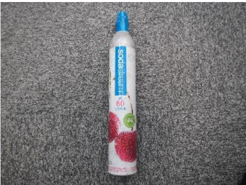
ふじみ野市 炭酸ガスボンベ 8月24日