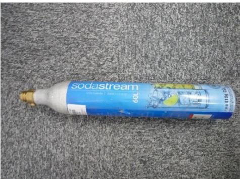
ふじみ野市 炭酸ガスボンベ 3月1日