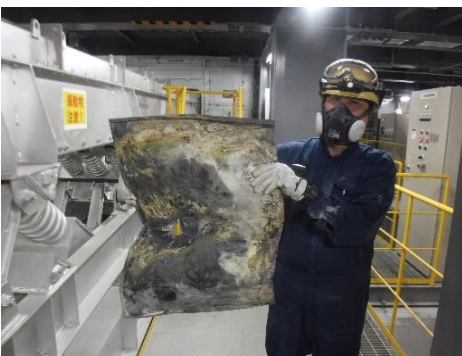
熱回収施設 鉄板 5月10日