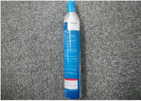
三芳町 炭酸ガスボンベ 1月23日