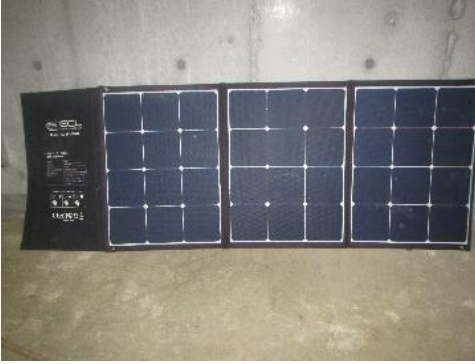
ふじみ野市 ソーラーパネル 11月7日