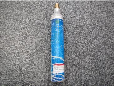
ふじみ野市 炭酸ガスボンベ 7月26日