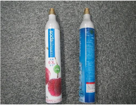
ふじみ野市 炭酸ガスボンベ 3月12日