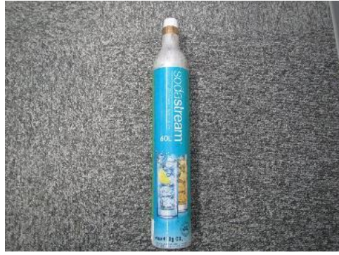
ふじみ野市 炭酸ガスボンベ 8月8日