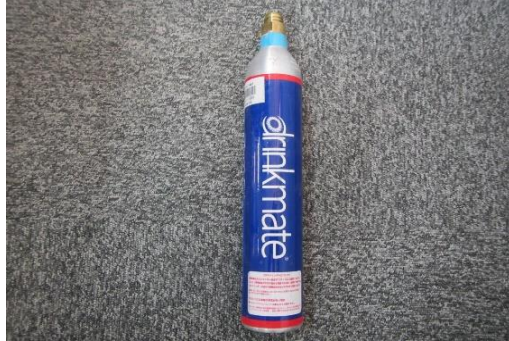
ふじみ野市 炭酸ガスボンベ 1月29日