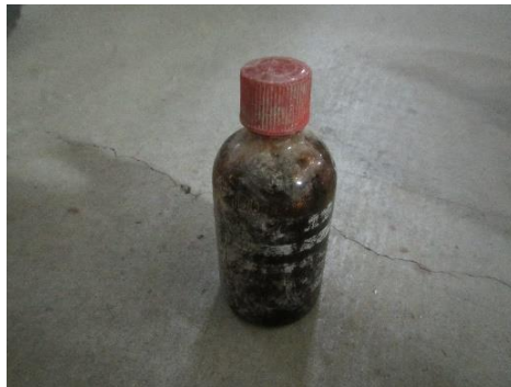
三芳町 薬品 3月6日